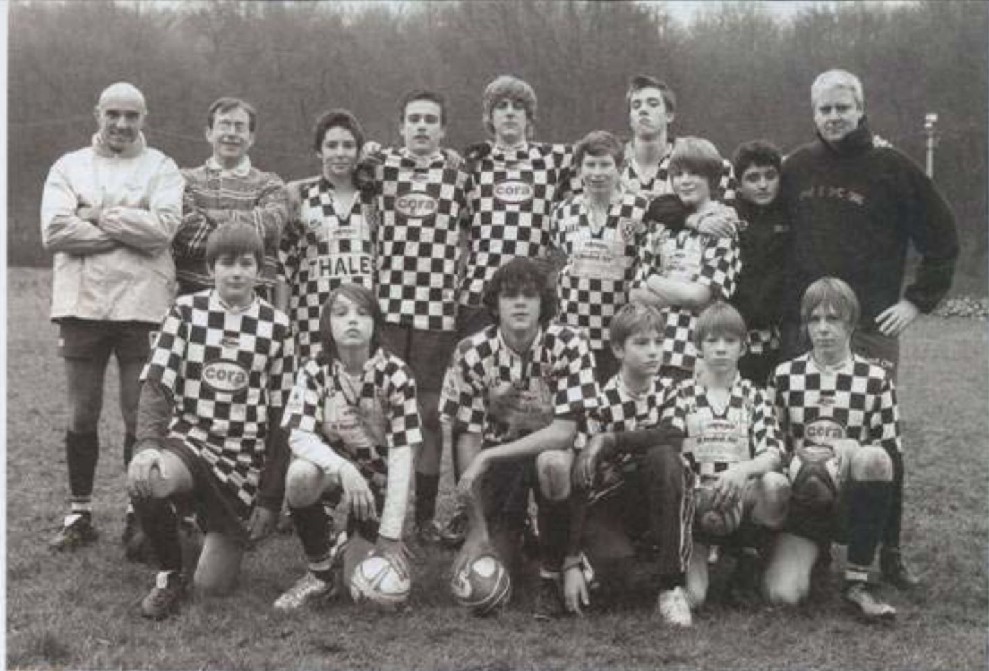
Csapat. Immáron nyolc éve oktat 7-14 éves gyerekeknek rögbi. Nem egyedül teszi ezt, hanem a barátai segítségével

Hogyan került kapcsolatba a hobbjával? Miért választotta éppen ezt?