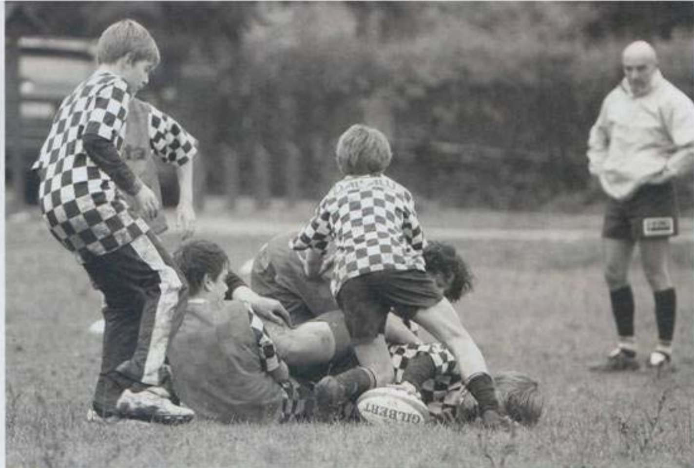
Hatás. Egyik főnöke nagy hatással volt rá, biztos, hogy néhány fiatalnak ő is példaképe lehet a sportban, az üzletben